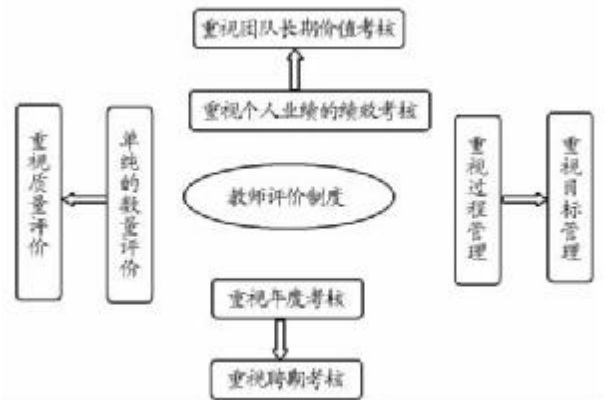
图2 专业教学团队考核制度的改革

最大潜能。考核内容除了教师科研成果外,还应包括个人教学业绩,将科研成果和教学业绩按一定比例进行评分,学校可以出台切实可行的评分细则。此外,学校要给团队提供完成工作所必需的人力、物力和财力,加大人才引进力度、教学仪器优先购置等。