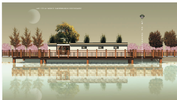
图 2 月客木质栈道

3.2 三条流线:栈道园桥 ①月客木质栈道。党校家属楼背后,以白色景墙来进行空间划分,以孤植大树为立面主景,和棕色木质栈桥形成横竖对比(图 2)。②景窗木质栈桥。西和书画院,以棕色仿木园桥围合成景窗造型,和棕色仿木围栏遥相呼应并融为一体,以红色廊架为立面主景,以白色门架为陪衬,形成浪漫、神秘的观景台(图 3)。③八卦木质园桥。香山街顶头,棕色仿木园桥围合成八卦形状,和绿色八卦图案遥相呼应(图 4)。