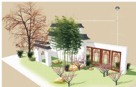
图 1 主要入口景观效果

3.2 三条流线:栈道园桥 ①月客木质栈道。党校家属楼背后,以白色景墙来进行空间划分,以孤植大树为立面主景,和棕色木质栈桥形成横竖对比(图 2)。②景窗木质栈桥。西和书画院,以棕色仿木园桥围合成景窗造型,和棕色仿木围栏遥相呼应并融为一体,以红色廊架为立面主景,以白色门架为陪衬,形成浪漫、神秘的观景台(图 3)。③八卦木质园桥。香山街顶头,棕色仿木园桥围合成八卦形状,和绿色八卦图案遥相呼应(图 4)。