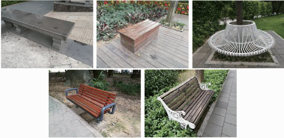
温泉公园常见无地域文化园椅园凳