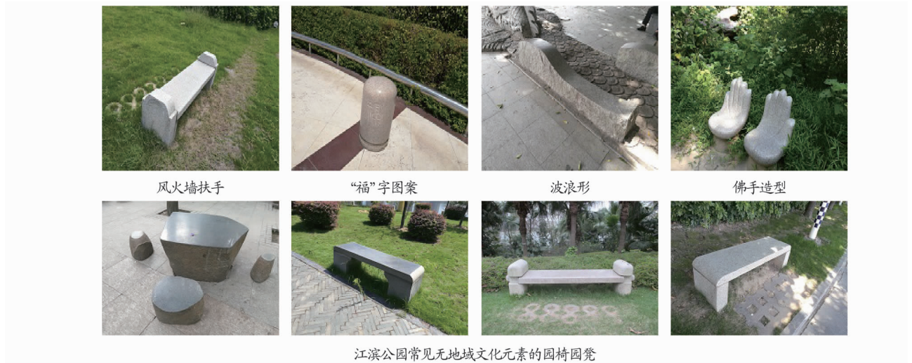
图2 江滨公园园椅园凳示例