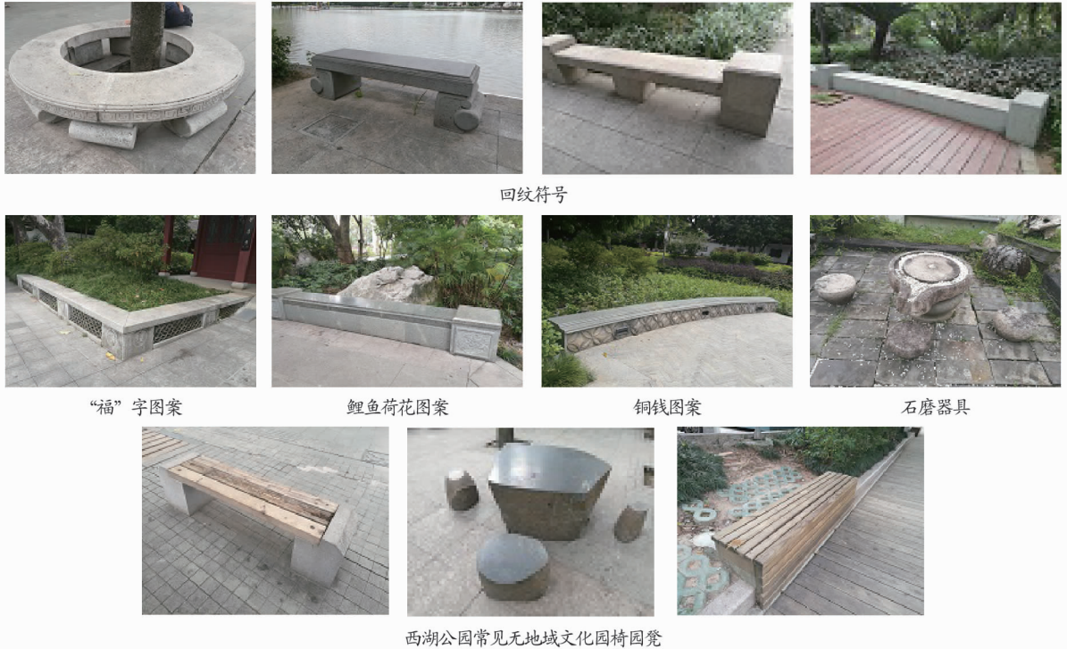
图 3 西湖公园园椅园凳示例