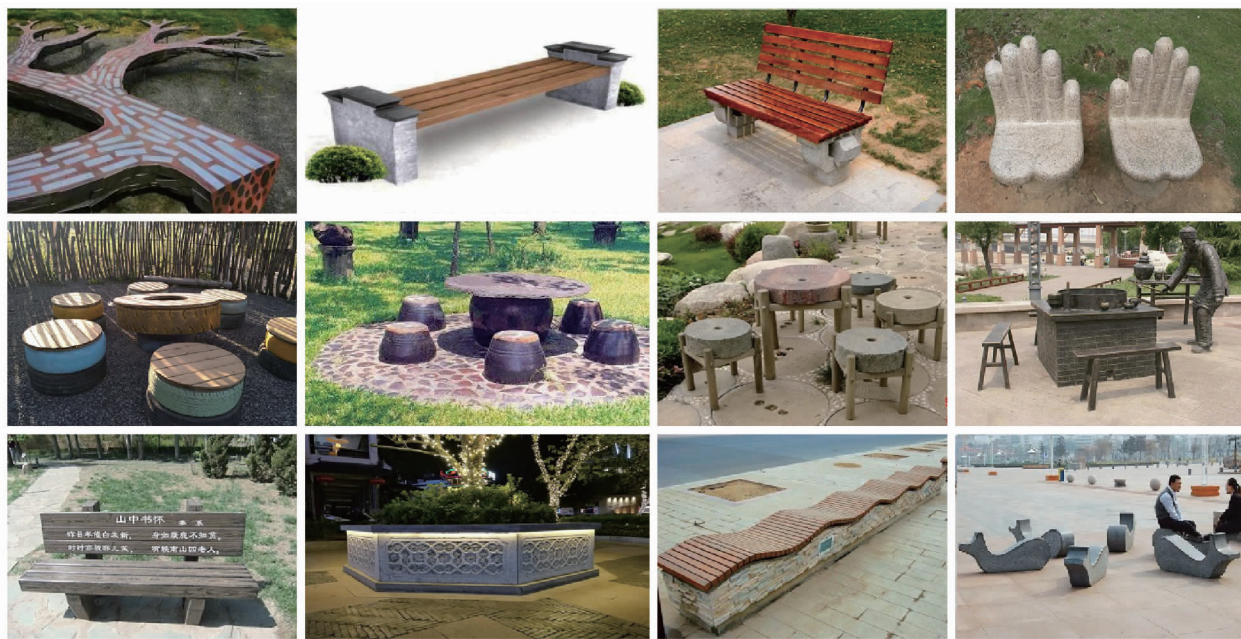
图 6 园椅园凳地域文化参考

此外,还应增多地域文化造型的园椅园凳数量,丰富园椅园凳中地域文化元素类型以及增加具有吉祥寓意的符号图案文化的运用。