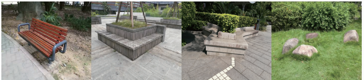
图1 园椅园凳的类型

园椅园凳是一种供游人休憩与观赏的小型建筑 [4] 。园椅园凳可分为2种类型,一种是显性,另一种是隐性。显性是指园林中传统意义上的休憩功能明确的休憩设施;隐性是指近代发展起来的、集多种功用于一体的休息空间设施,如树池、花坛和置石等 [5] (图1)。