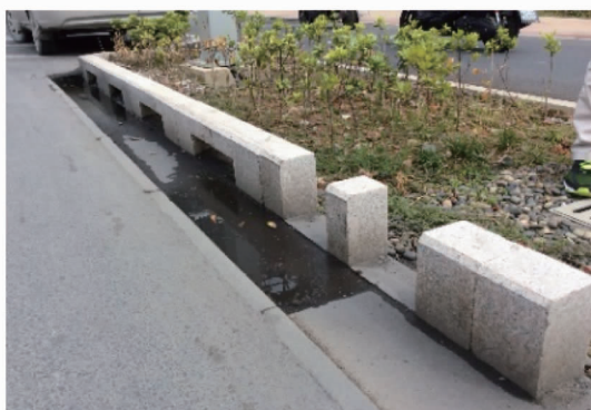
图 3 路缘石设置缺口