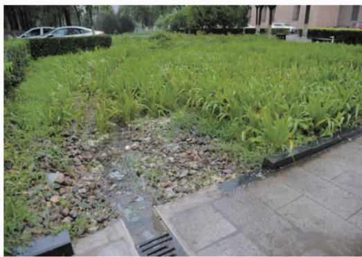
图 5 下沉式绿地的雨水口设卵石 [25]