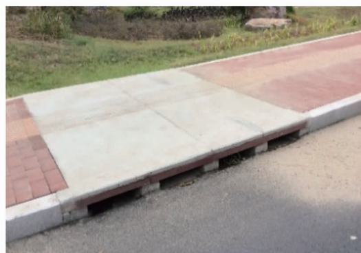
图 4 人行道设置缺口