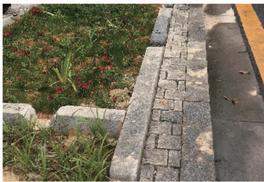
图 2 路缘石与地表高度一致

4.4 避免次生危害 下沉式绿地建设的目的是解决城市问题,要尽量避免因为下沉式绿地建设出现滞水、积水、植物死亡、土壤流失等次生危害,不能因为解决老问题而产生新问题。既要在下沉式绿地设置溢流口,且顶部标高一般高于绿地 5~10 cm [3] ,以保证暴雨时溢流口及时排放过多雨水,又要在雨水集中入口铺设卵石 [14] (图 5)以避免因长期雨水的冲刷而造成土壤流失。还应结合不同汇水面的径流水质分类研究 [23] ,利用 GIS 技术对雨水处置方案进行规划设计 [24] ,并设计截污雨水口、截污检查井或截污树池等 [14] ,以避免污染较重的道路、停车场等场地的雨水将污染物带入绿地,避免次生危害的发生。