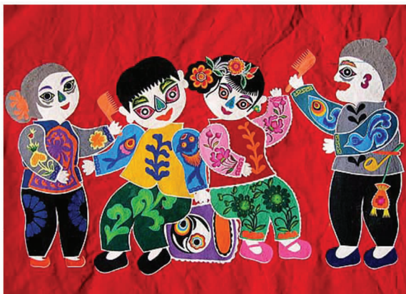
图6 陕北民俗风韵的布堆画