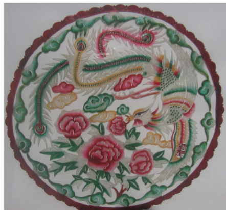
图7 剪纸元素的皮影