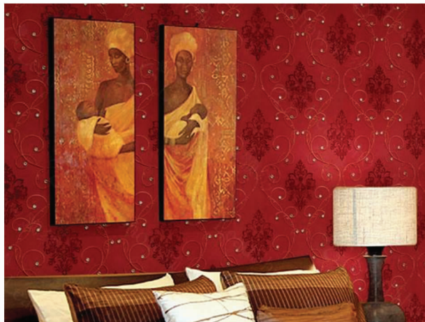
图10 刺绣墙布的墙面装饰

2.2 刺绣艺术在室内设计中的应用 刺绣在室内设计中的应用主要有两种表现形式:一是将刺绣工艺和装饰材料相结合,如领袖刺绣将手工刺绣技艺嫁接到墙布上,营造出室内高贵大气的奢华感(图10);二是将纯刺绣以装饰画或屏风、隔断的方式作为室内的陈设艺术品来表现现代装饰艺术。