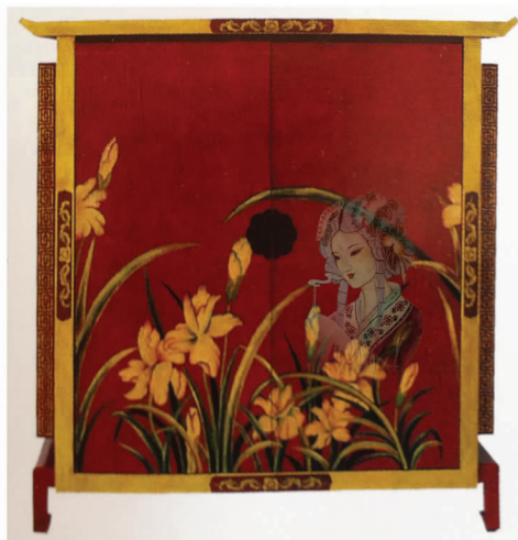
图 16 皮影元素彩绘家具