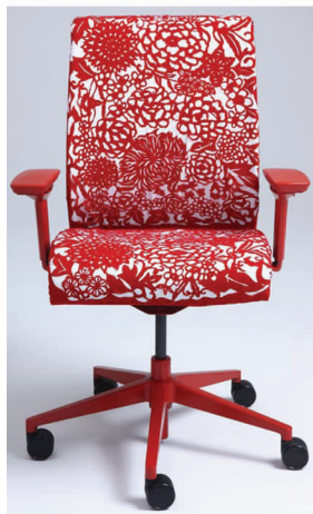
图8 剪纸元素的座椅

的艺术表现形式,在现代室内设计中的应用十分广泛。带有剪纸元素的隔断、灯具、家具等 [9] ,是一种艺术符号,更是一种特殊的民族语言和地方文化。如图8所示,设计师提取了剪纸元素中的红色,又提取了剪纸的造型来装饰座椅,给现代造型的座椅营造了浓浓的文化韵味;镂空的大幅剪纸墙壁装饰,把整个空间装饰得大气、喜庆(图9)。