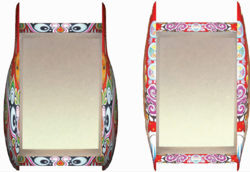
图13 抽象的马勺脸谱的壁龛设计