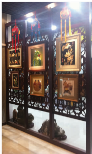
图 15 木雕花式的隔断