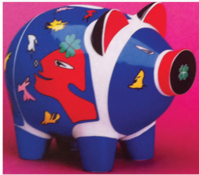
图12 小猪泥塑工艺品