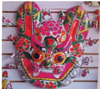
图2 陕西凤翔泥塑挂件

1.5 社火马勺脸谱 社火马勺脸谱为陕西民间所独有,由中国民间社火脸谱演化而来。马勺即水瓢,是旧时民间舀水和取粮食用的工具,一般采用桐木、柳木制作而成。社火马勺脸谱即绘制有陕西社火脸谱图案的马勺。社火马勺脸谱的图案多取自神话传说中的正义人物,并以人物的容貌和性格特征出发 [6] ,采用云纹、火纹、水纹(图5)等不同纹饰的组合,以夸张的手法描画人物的五官部位和肤色,强调色彩对