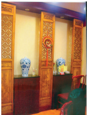
图 14 墙面隔断装饰

型的“磐石文具”杂件作为石雕中的陈设小品,常被置于书桌或案桌之上,作为欣赏与实用相结合的工艺雕刻品,能够体现个人的喜好,营造室内环境的情趣;而石狮多用于宅院或某些公共建筑的入口两侧,起到装饰门厅的作用,也取其驱邪除恶的守护神之意。