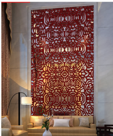
图9 剪纸元素的墙面装饰

2.2 刺绣艺术在室内设计中的应用 刺绣在室内设计中的应用主要有两种表现形式:一是将刺绣工艺和装饰材料相结合,如领袖刺绣将手工刺绣技艺嫁接到墙布上,营造出室内高贵大气的奢华感(图10);二是将纯刺绣以装饰画或屏风、隔断的方式作为室内的陈设艺术品来表现现代装饰艺术。